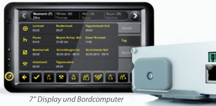
7" Display und Bordcomputer

Der digitale Tachograph zeichnet die Fahr- und Pausenzeiten Ihrer Fahrer auf. cargorent sammelt die Daten des DTCO über ein Modem ein und sendet sie an die Cloud-Plattform. Die Daten der Fahrerkarte können online und von überall ausgelesen werden. Ergänzt um die Tätigkeitsdaten der Fahrer aus der cargorent Telematik und den ebenfalls erfassten Ortungsdaten erhält die Lohnbuchhaltung in der Zentrale alle wichtigen Informationen zur korrekten Abrechnung von Arbeitszeit, Leistungslohn und Spesen. Ganz ohne handschriftliche Belege, ohne fehlerhafte Angaben, ohne Verdross.